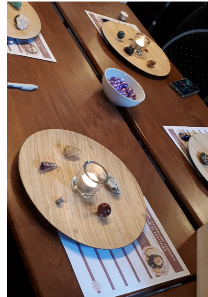
Boodschap van de edelstenen